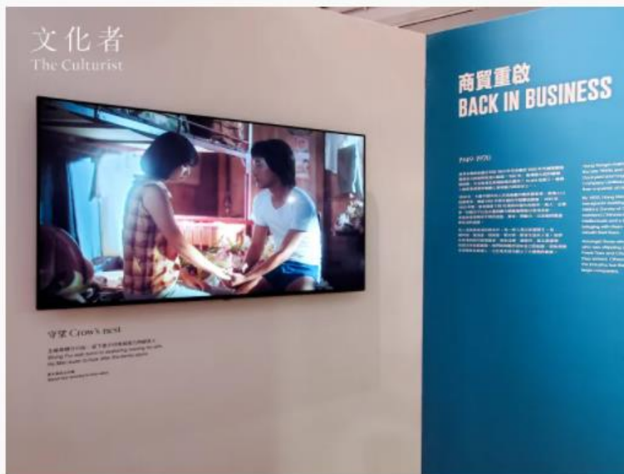
麥曦茵執導的五齣微電影目前只能於展覽內觀看。