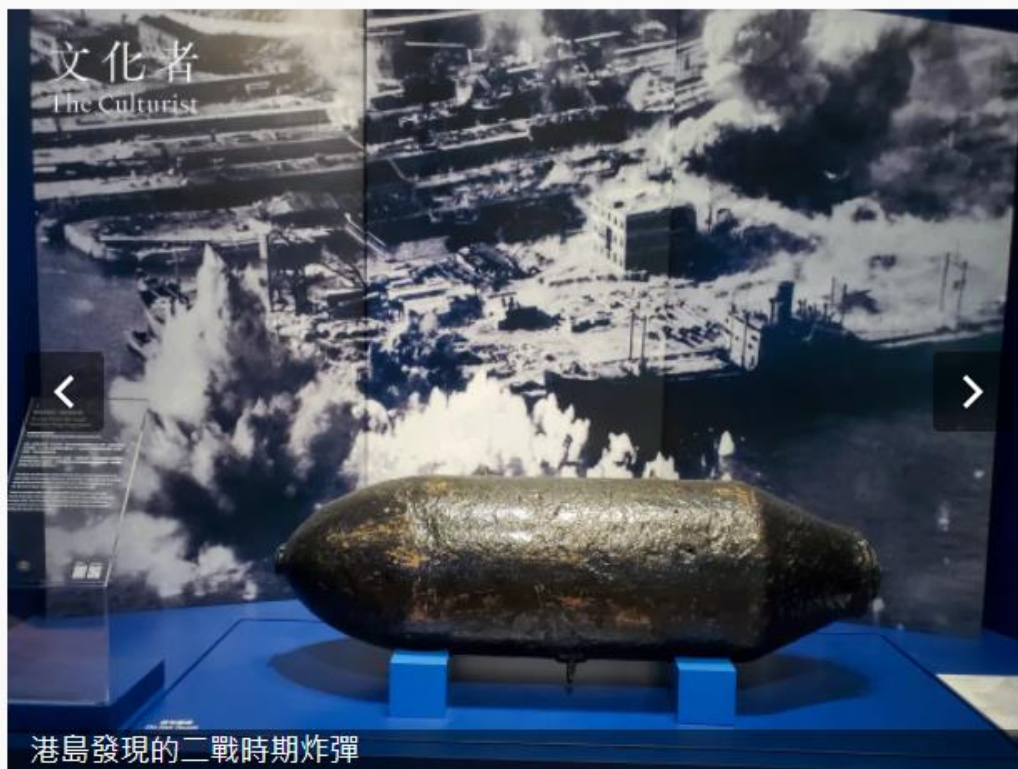
港島發現的二戰時期炸彈

一枚於跑馬地出土的二戰時期炸彈，現被投放於中環碼頭旁的香港海事博物館，作為港口故事的序幕。近日由海事博物館籌備的特備展覽「香江泛洋奇蹟」，展示了25件具標誌性的展品，當中既有「香港製造」的工業產品，也有與天星小輪、海員與貨櫃碼頭相關的文物，展品看似多元，其實貫連起來便是四代香港人的集體回憶。