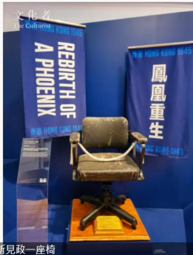
日本海軍中將新見政一座椅