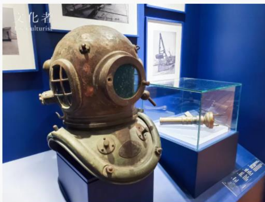
由倫敦西貝戈曼公司 ( Siebe, Gorman & Co. Ltd ) 所製的潛水頭盔