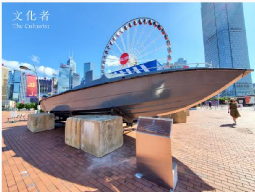
1990年代走私者使用的「大飛」置於中環海旁

居於香港，我們的記憶好像總有一部分保留給了海洋，不論是來往維港兩岸的天星小輪、已屬回憶的珍貴海鮮舫，又或單是捧於手上的智能電話、穿在身上的衣服和鞋子，亦同樣受益於航海業。這個由海洋串連起來的香港故事，其中一個重要的敘述始點在於1945年，時值戰後重生之年，香港和海洋漸以不同的形式彼此連繫，並隨時代推演而發展出別樣的意義。