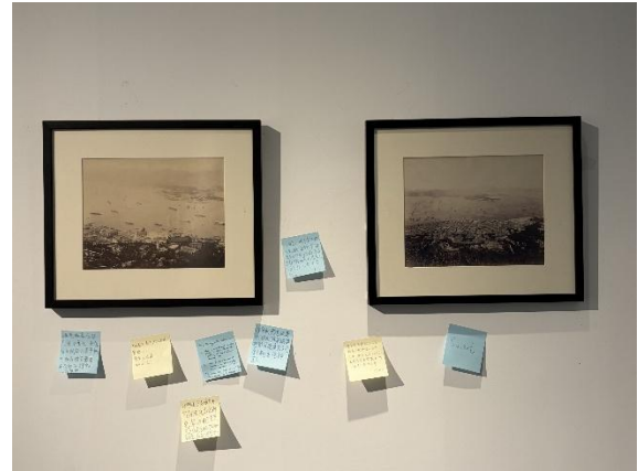
(「維多利亞港與我們」展覽 - B5 展覽廳)

除了這些趣味活動，遊客還可以前往長廊展覽廳和 B5 展覽廳，揭幕全新教育項目「藝術貨櫃啟航」。其後，B6 展覽廳正在舉辦名為「維多利亞港與我們」的全新展覽，繼續為您帶來精彩的體驗。展覽展出了 18 張從 19 世紀 60 年代到 20 世紀 70 年代的歷史照片，宛如一台時光機，帶您穿越時空，追溯維多利亞港的演變歷程。歡迎蒞臨博物館，分享您的故事，並在照片下方留下您的留言。您的文字將成為這段歷史最真誠的註腳。