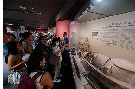
( 策展人導賞 )