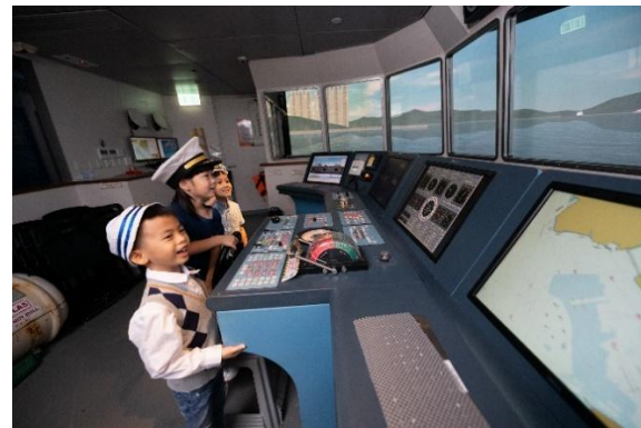
( 模擬駕駛體驗 )

開放日由太平洋航運（香港）有限公司贊助，該公司是全球最大的小靈便型乾散貨船，及超靈便型乾散貨船船東及營運商。此次活動得到了多個合作團體的支持，包括香港幼兒教育及服務聯會（幼聯）、香港導賞員學會、香港課外活動主任協會、香港理工大學專業及持續教育學院學生事務處、香港航海學校、水警海港警區警民關係組、香港海員工會、香港海事青年團、海事專才推廣聯盟、海事訓練學院、永恒教育基金有限公司及 YOU AND ME 基金會。這一合作彰顯了合作夥伴們對海員的尊重，和向香港市民大眾分享海事知識的承諾。