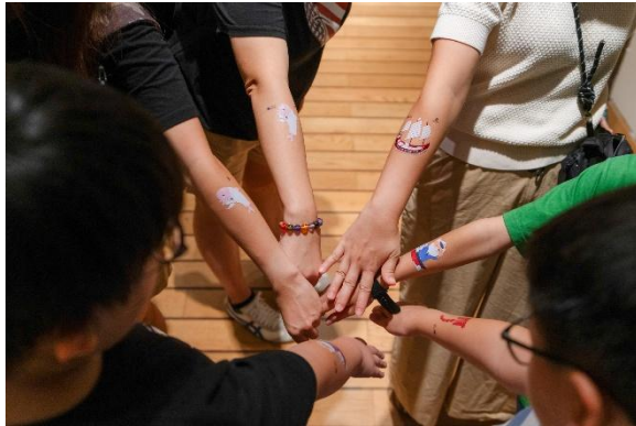
( 紋身貼紙體驗 )