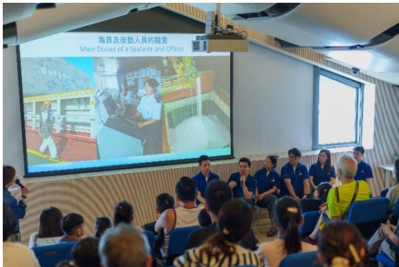
(海員真人圖書館:後生也行船)