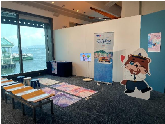
(「藝術貨櫃啟航」 - B5 展覽廳)