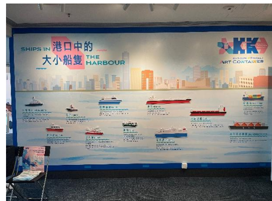
(「藝術貨櫃啟航」- B5 展覽廳)