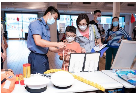
(香港海員工會提供繫泊安全遊戲)

由海運及空運人才培訓基金資助，本館將於 2023 年 11 月 25 日免費開放予公眾參觀。是次同樂日與多個機構一同舉辦，合作機構包括海事處、香港打撈及拖船服務有限公司、香港海員工會、香港海事青年團、香港拯溺總會、大自然保護協會、香港童軍總會及職業訓練局。