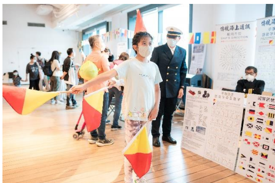
(香港童軍總會展示國際信號旗)