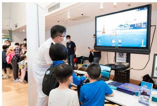
(香港海事青年團提供船舶模擬器遊戲)