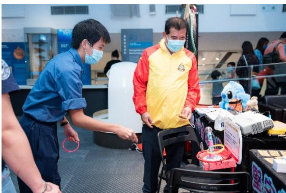
(香港拯溺總會的遊戲攤位)