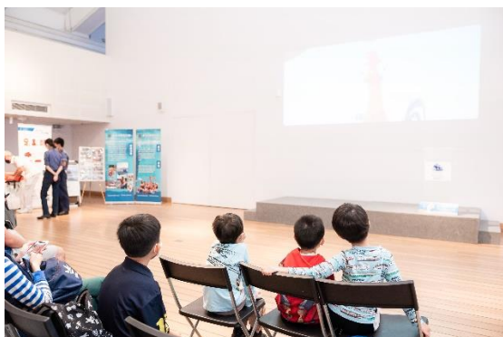
(海洋卡通電影播放)